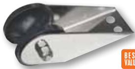
Puntera fija, INOX 304