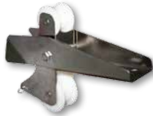
Puntera basculante, Inox 316