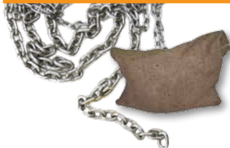
Cadena calibrada galvanizada al fuego DIN 766, Bolsas